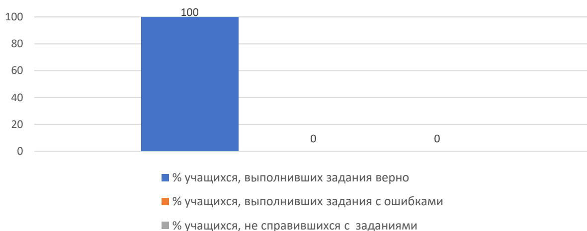
Рисунок 3. Основные результаты ДР по географии

На рисунке 3 представлены основные результаты ДР по географии в Кавалеровском муниципальном районе.