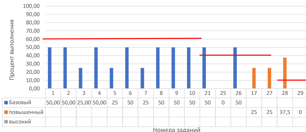
Рисунок 2. Задания, по которым участники не преодолели минимальный порог

Анализ результатов участников и типов заданий, попавших в перечень (табл. 2, рис. 2), выявил следующие частые затруднения участников экзамена: